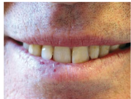
FIGURE 3 Télangiectasies muqueuses.